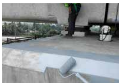
Broprosjekt i Malaysia