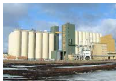
Siloprojekt i Norge