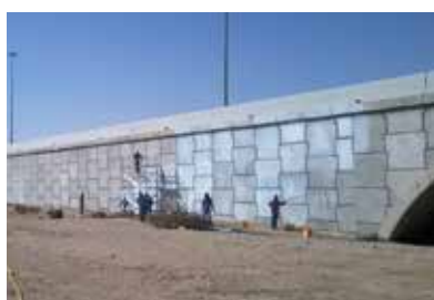
Broprosjekt i Qatar

Overflatebeskyttende beleggssystemer fra Sika er designet og brukt i stor utstrekning for å motstå alle typer vær og klimaforhold, fra vinterkulden i Nord-Amerika og Øst-Europa, varme og fuktighet i Sentral- og Sør-Amerika eller Asia, til den tørre varmen i Midtøsten og ørkenregioner rundt om i verden.