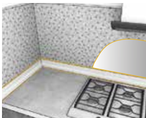
Liming av bordkanter og sprutsikre flater over komfyr

Bredt bruksområde! God vedheft uten forbehandling