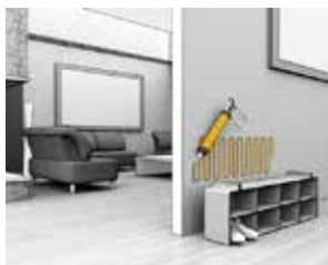
Liming av skap på veggen