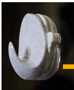
Gjør limingen usynlig!