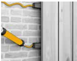
Liming av trebjelker