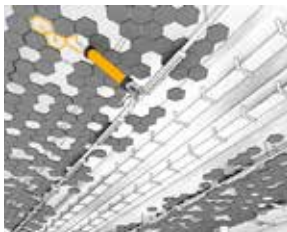
Liming av tak for lyddemping