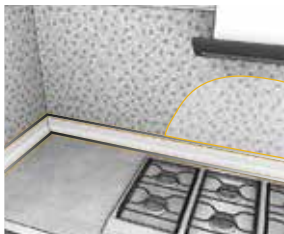
Liming på glass og overflater