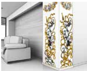
Liming av dekorprofiler