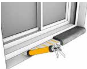
Liming av vinduskarmer innvendig