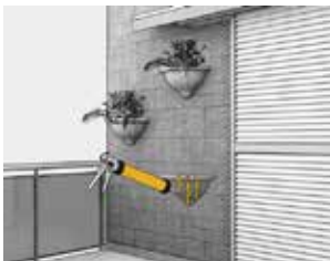
Liming av tunge gjenstander direkte på veggen