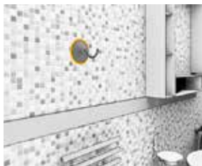
Liming av kroker og knagger