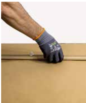
Fester raskt ved påføring