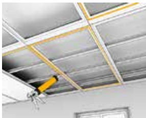
Liming av plater til trerammer