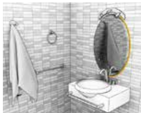
Liming av speil