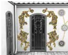
Liming av dekorelementer