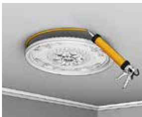
Liming av stukkatur

Limet for innendørs listverk og dekor - høy sluttstyrke