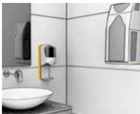
Liming av tunge gjenstander