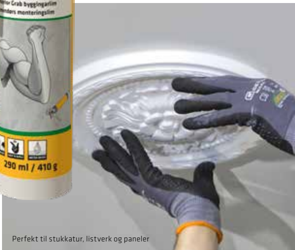
Perfekt til stukkatur, listverk og paneler