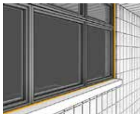
Fuging rundt vinduer