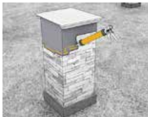
Liming av stein og murblokker