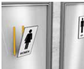
Liming av skilt