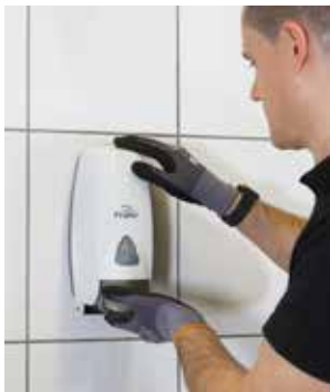
Montering av tunge gjenstander